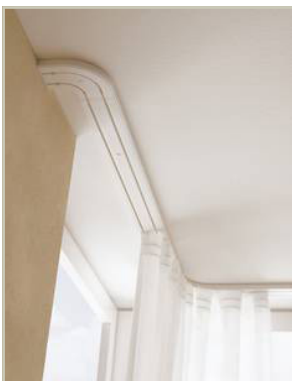
Abb.2 (Rechtwinkliges Eckstück)

Glatte Gardinen ohne Raffung für Raumteiler in z.B. Büros sind nur mit der Auswahl von Kräuselfaltenband oder vorhandenen Paneelwagen (Schiebegardinen) möglich. Abb.7