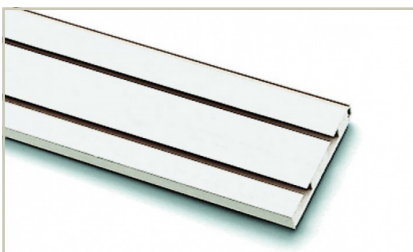
Abb.4 (Gardinenschiene Decke - 2-läufig)