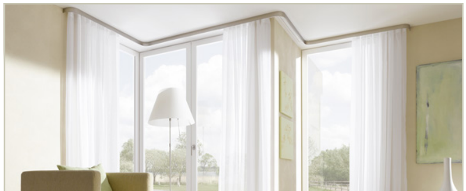
Abb.3 (Auch ausgefallene Variationen sind möglich - Schirmung von Ecken auch weiterlaufend in Wände)