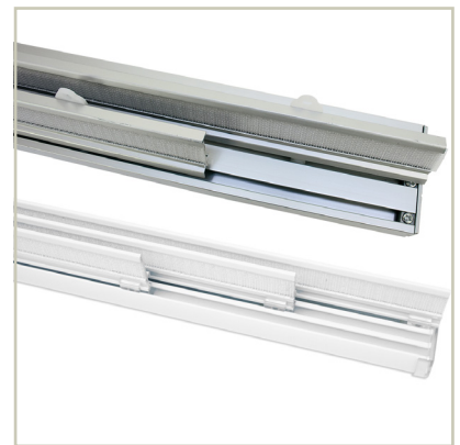
Abb.7 (Paneelwagen für Schiebegardinen)

Bitte beachten Sie: Biologa liefert keine Gardinenstangen /-schiene und Zubehör.